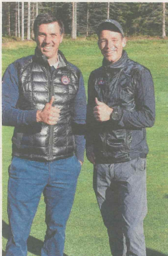
Die beiden Ski-Ikonen Mario Matt (l.) und Benni Raich.